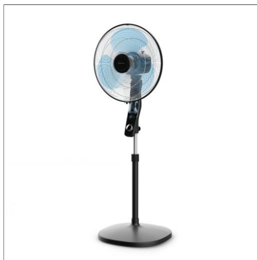
Essential+, Ventilateur sur Pied, 55m 3 /min, Silencieux 49dB, Anti-Moustique VENTILATEUR SUR PIED VU4420F2