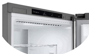
Affichage intérieur discret