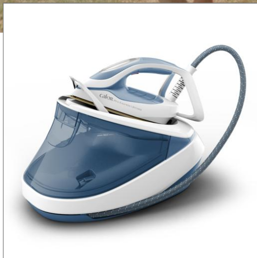
PRO EXPRESS ULTIMATE II CENTRALE VAPEUR YY5357FC