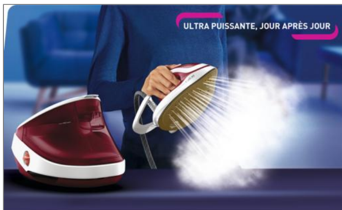
PRO EXPRESS ULTIMATE II 3000 W GRENAT ET BLANC CENTRALE VAPEUR GV9711C0